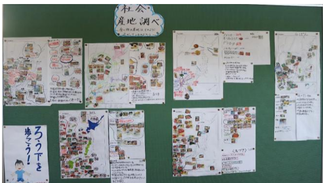
5年生 社会科 産地調べ