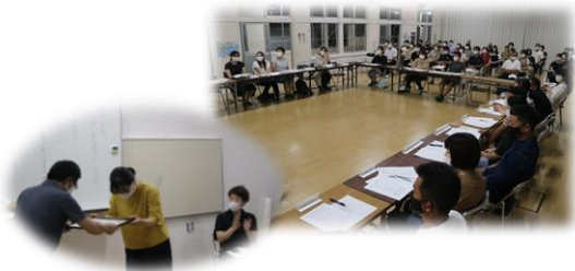
育友会 常・代議員会