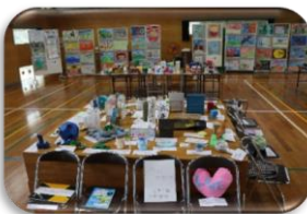
夏休み校内作品展

学校行事や育友会の会議等も徐々に再開していきます！（感染予防と開催の工夫をしながら）