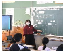
研究発表会 先行授業 (5年1組)