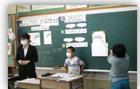
研究発表会 先行授業 (2年2組)