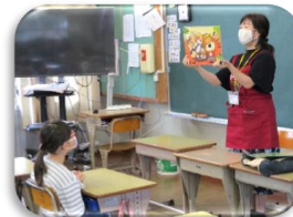
梅ちゃん(読み聞かせ)