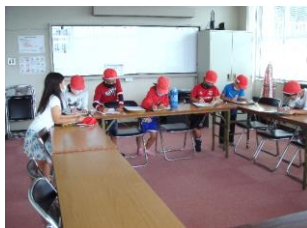
安中公民館見学 (2年)