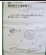
ルックルックストリートの算数問題