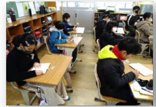
朝の会が始まる前の「隙間時間」を活用して読書をする高学年です。

※ [(よくあてはまる + ややあてはまる) ÷ ? を除く回答数] で算出したのが肯定的割合です。