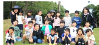
10/22 1年生学習遠足「秋みつけ」

終戦まもない1947年(昭和22)年、まだ戦火の傷痕が至るところに残っているなかで「読書の力によって、平和な文化国家を作ろう」という決意のもと、出版社・取次会社・書店と公共図書館、そして新聞・放送のマスコミ機関も加わって、11月17日から、第1回『読書週間』が開催されました。そのときの反響はすばらしく、翌年の第2回からは期間も10月27日～11月9日(文化の日を中心にした2週間)と定められ、この運動は全国に広がっていきました。そして『読書週間』は、日本の国民的行事として定着し、日本は世界有数の「本を読む国民の国」になりました。【公益社団法人 読書推進運動協議会 より】