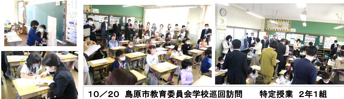
10/20 島原市教育委員会学校巡回訪問 特定授業 2年1組