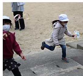
元気いっぱい! 1年生です