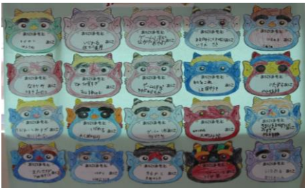
1年生教室前の掲示より