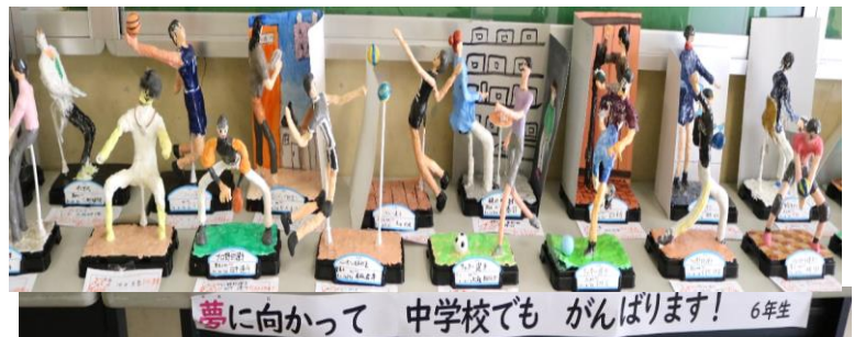
夢に向かって 中学校でも がんばります! 6年生