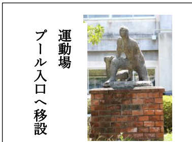
運動場 プール入口へ移設